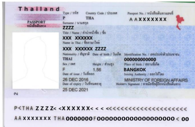
(ตัวอย่างหน้าพาสปอร์ต และรูปถ่าย)

3. พาสปอร์ตเล่มจริง ต้องมีหน้าว่าง สำหรับประทับตราวีซ่าและตราเข้า-ออก อย่างน้อย 2 หน้าเต็ม ลูกค้าถือไปที่สนามบินเอง ณ วันเดินทาง (หนังสือเดินทางต้องเป็นเล่มที่ส่งชื่อให้เราทำวีซ่าเท่านั้น!!)